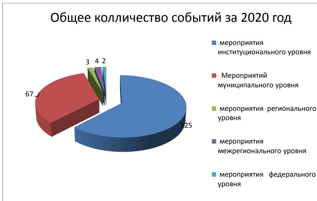
Рисунок 2. Общее количество событий за 2020 год

В 2020 учебном году сотрудники Дворца организовали 123 события на институциональном уровне. Не смотря на режим повышенной готовности, карантин мероприятий проведено было больше в сравнении с прошлым учебным годом, в связи с Юбилеем Дворца и, не смотря на полную отмену мероприятий весенних. Ряд мероприятий состоялось в дистанционном формате. Без этих мероприятий было невозможно в полной мере реализовать цели образовательных программ, создать крепкий педагогический и детский коллектив.