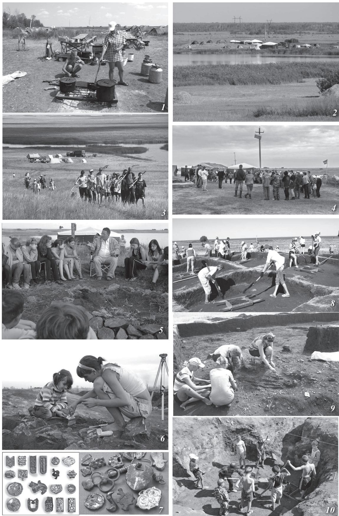
Рис. 1. Социальные составляющие южноуральской археологии. 1-4 -социальный аспект; 5-6 -образовательный; 7-10 -исследовательский