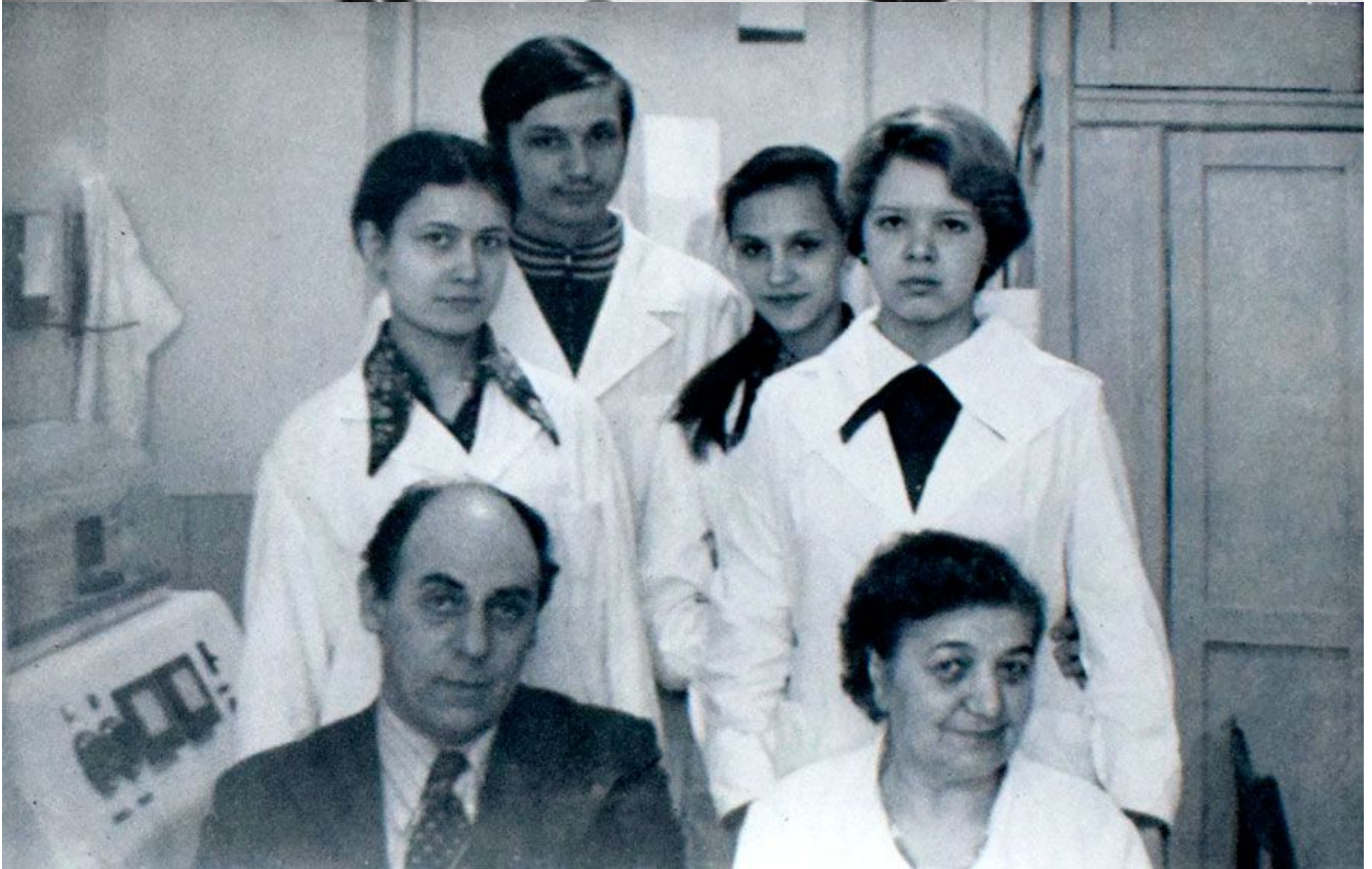
Организаторы городского университета «Юный медик»: