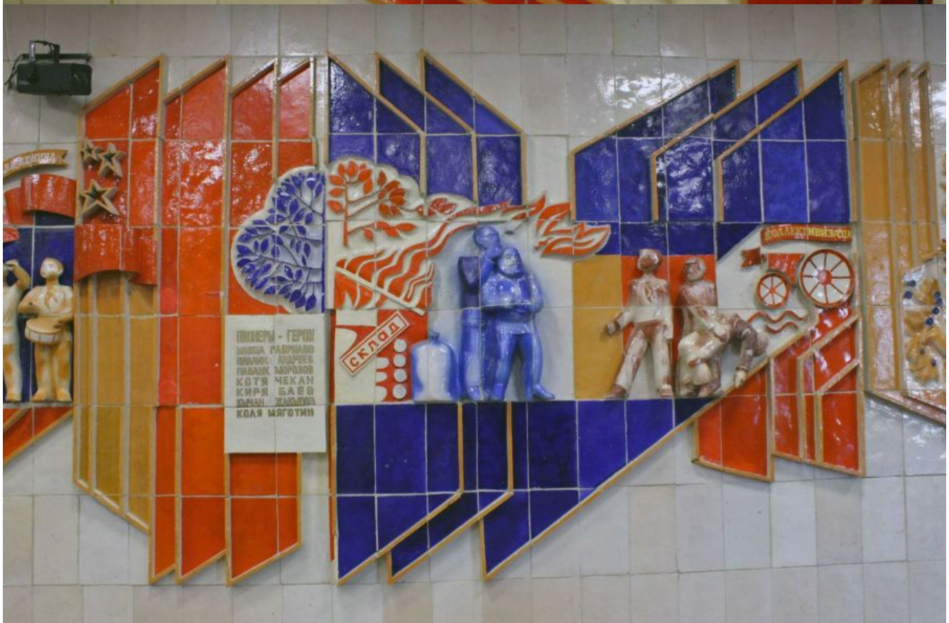
Фрагмент второй: «Так поступают пионеры: 20-е-30-е годы»